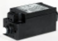
SL-166, SL-167, SL-168