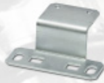
Winkel für SL-168