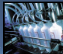
CHEMIE & FOOD