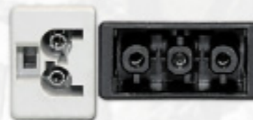
Leuchtenseite rechts, Anschluss für SL-172, SL-173, SL-177, SL-188