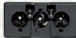
Leuchtenseite links, Anschluss für SL-170 & SL-171