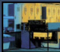
MASCHINEN- UND ANLAGENBAU