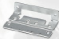
Winkel für SL-166, SL-167