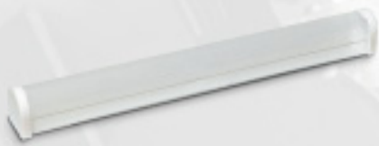
SL-008, SL-014 / 015 / 018 / 030