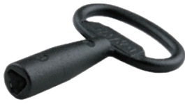
Clé en Zamak Triangle 7 mm - SV-5924 8 mm - SV-5984