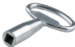
Schlüssel GdZn Doppelbart 7 mm - SV-5923 8 mm - SV-5983