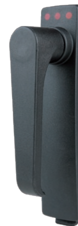
SV-5331 Klinkengriff, ohne Zylinder, Polyamid GF