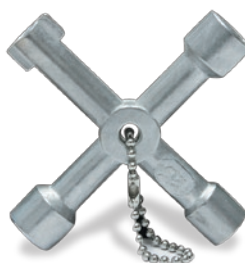
Multifunktions- Schlüssel SV-5990