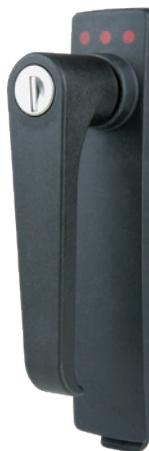
SV-5330 Klinkengriff mit Zylinderschloss, Polya- mid GF, gleichschl.