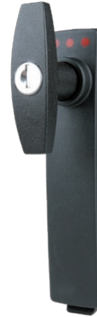
SV-5320 Knebelgriff mit Zylinder- schloss, Polyamid GF, gleichschließend