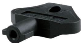
SV-5936 Schlüssel 3mm Doppelbart Polyamid