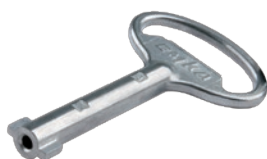
Schlüssel GdZn Doppelbart 3 mm - SV-5926 5 mm - SV-5925