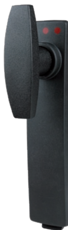
SV-5321 Knebelgriff ohne Zylinderschloss, Polya- mid GF