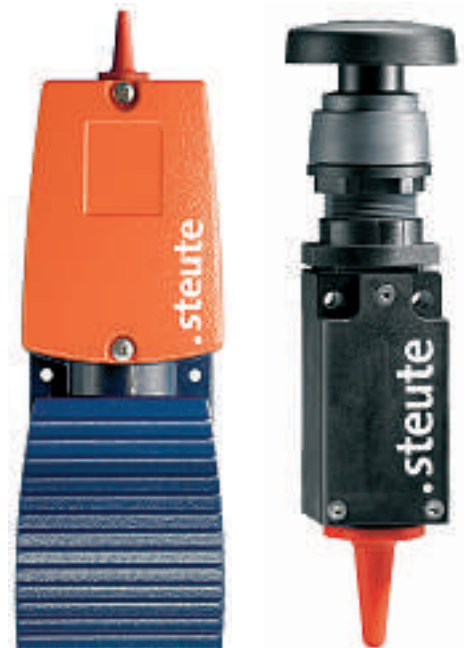
Der Verzicht aufs Kabel bringt Vorteile bei Ergonomie und Arbeitssicherheit

Carl Geisser AG Industriestrasse 7, 8117 Fällanden Tel. 044 806 65 00, Fax 044 806 65 01 info@carlgeisser.ch, www.carlgeisser.ch