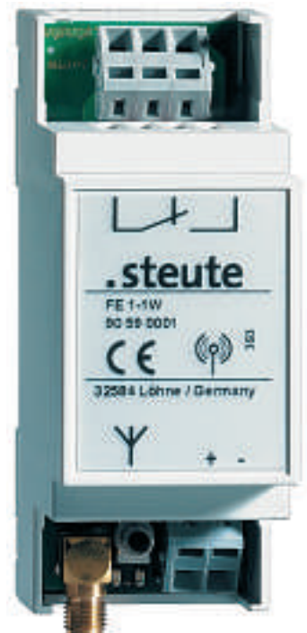
Der einkanalige FE1 für Empfangseinheiten ist neu in diesem Programm